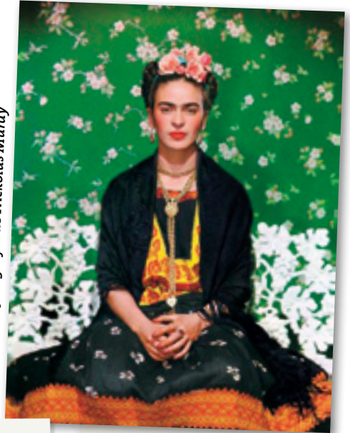
Frida Kahlo